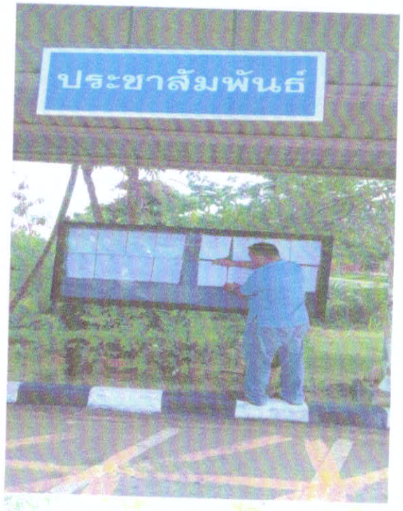
ภาพประกาศเผยแพร่แผนการจัดซื้อจัดจ้าง ประจำปีงบประมาณ พ.ศ. ๒๕๖๔